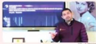
TIJUANA.- Pérez Rico previó que el regreso a clases presenciales será un ensayo en no más de diez escuelas, con todos los protocolos.