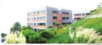
TIJUANA.- Los montos que el Colef gasta en chefs son considerados un insulto para algunos académicos.