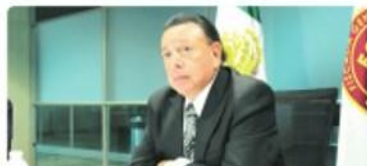
TIJUANA.- El estado de Baja California avanzó en diversos rubros durante el mes de febrero, destacó Jaime Bonilla Valdez.

TIJUANA.- Reafirma la Fiscalía General del Estado el compromiso de esclarecer las desapariciones en la entidad.